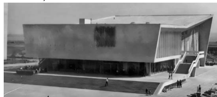
В 1973 году тольяттинцы смотрели все премьеры советского кино. К этому времени уже построен кинотеатр «Сатурн» на 1200 мест.

11 августа состоялась премьера телесериала «Семнадцать мгновений весны» на Центральном телевидении. В 1973 году на экраны СССР выходят фильмы, ставшие впоследствии любимыми и широко известными: «В бой идут одни «старики» Леонида Быкова, «Иван Васильевич меняет профессию» Леонида Гайдая, «Калина красная» Василия Шукшина.