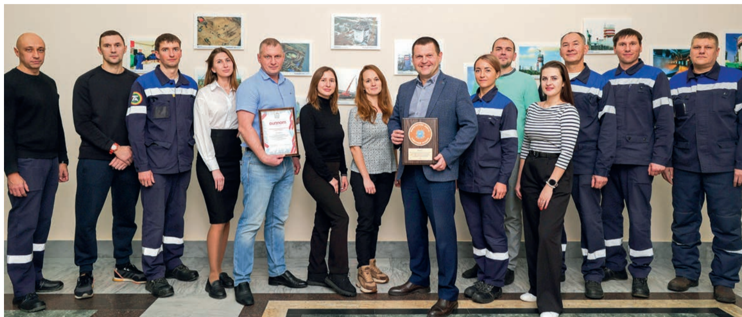
Спортивные активисты ТООЗа. Их выбор – быть успешными

В 2023-м в конкурсе участвовали 30 организаций. Определяя лидера, жюри учитывало постоянство спортивной работы, поддержку и популяризацию здорового образа