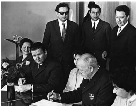
Госкомиссия присваивает право использовать знак качества производственному объединению «Куйбышевазот», которое и построило ТОАЗ

В 1973-м идут переговоры о строительстве в Тольятти аммиачного завода. Под будущий «Тольяттиазот» выделен земельный участок между двумя сёлами – Зелёновкой и Васильевкой. Производство удобрений решили строить сразу после визита в США Леонида Брежнева, генерального секретаря ЦК КПСС. Это случилось 18-25 июня 1973 года. В течение года вели проектные работы и согласования по выделению участка земли, определению техногенной нагрузки на окружающую среду.