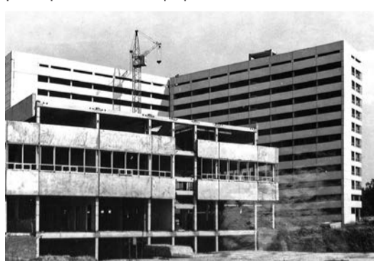
В том же году в Тольятти готовились применить на практике достижения других наук – связанных с медициной. в медгородке строят хирургический корпус, который горожане сразу назвали «книжкой»

В январе того же года советская станция «Луна-21» доставила на планету-спутник Земли модуль «Луноход-2». Космическая программа СССР в 1973-м обширна: запущены четыре аппарата к Марсу для его исследования, однако два аппарата промахнулись мимо орбиты, а один из-за разгерметизации проработал всего 17 дней.