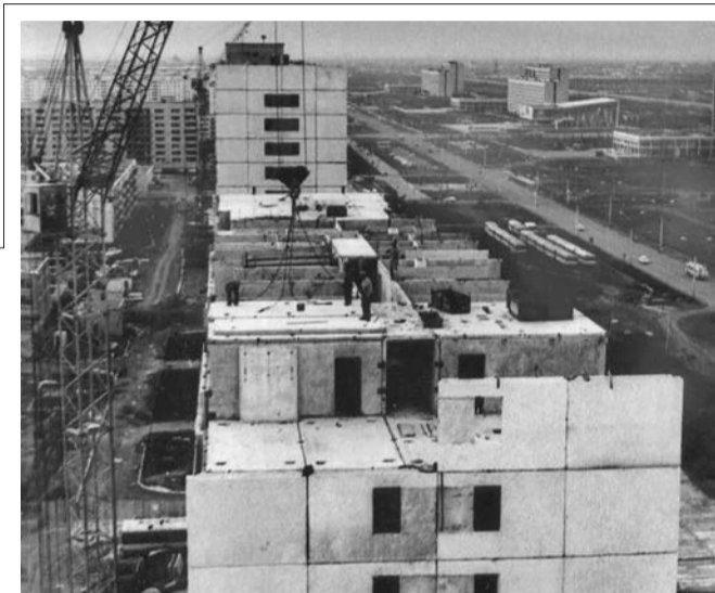
1973 год. В Автозаводском районе идёт застройка первого жилого квартала, а на улице Мира появился целый ряд девятиэтажек.