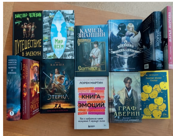
Толозовские читатели чаще всего выбирают исторические романы, детективы, фантастику и фэнтези, мелодрамы, приключения, биографии и мемуары

Фэнтези выделится как поджанр фантастики, его поклонников привлекает магия, волшебство и погружение в вымышленные миры. Фэнтези, как правило, издают многотомными циклами. Цикл «Отблески Этерны» Веры Камши журнал «Мир фантастики» назвал лучшим образчиком исторического фэнтези. Это произведение экранизировано, по нему созданы комиксы и видеоигра. Если читатели хотят познакомиться с популярным фэнтези, они могут взять в библиотеке профкома первый том цикла «Красное на красном».